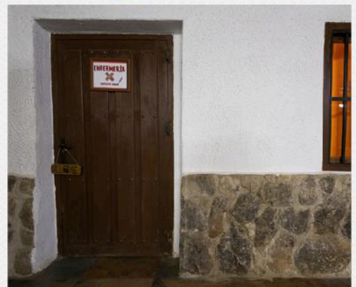
SERVICIO SANITARIO PROPIO 24H EN EL ALBERGUE